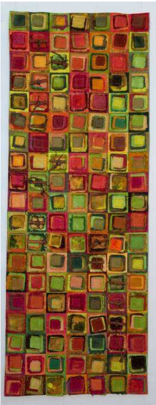
1. Preis: E. Graf, Küttingen 'Herbststimmung am Hasenberg'

Die dreiköpfige Jury hatte dann die schwierige Aufgabe, drei Gewinnerinnen auszuwählen. An der Vernissage am Samstag konnten dann die glücklichen Gewinnerinnen bekannt gegeben werden: